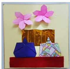
次回作成予定の 作品

日時 2015年2月4日(水) 10:00 ~ 場所 1階 和室 定員 10名 材料費 100円