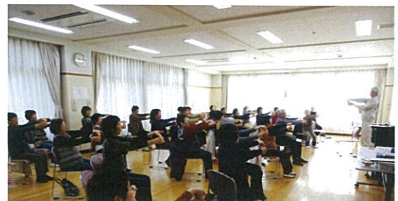
でん伝体操(無料)(毎週水曜日9:30)

その他の施設: 大広間、休憩室、和室3部屋、中会議室2部屋、小会議室、多目的ホール