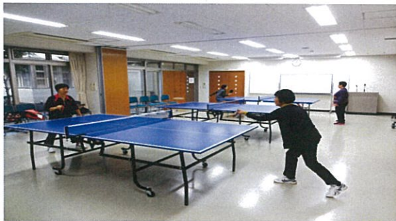
卓球 (無料)会場は会議室を使用